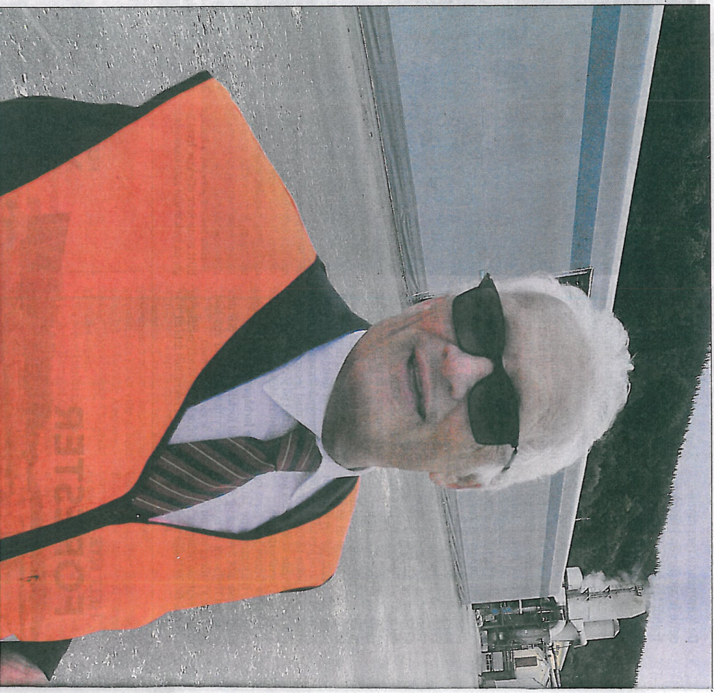
SIAL INVESTERE: – De to første årene vil vi ta mindre investeringer for å fjerne flaskehalsen. Deretter vil vi investere for å øke produksjonsvolumene.